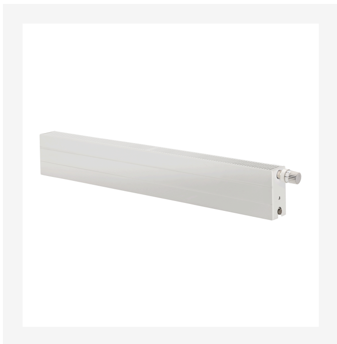
ProductImage - Panel radiator Plint R, 200 mm.