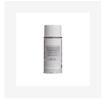
Aérosol peinture réparation