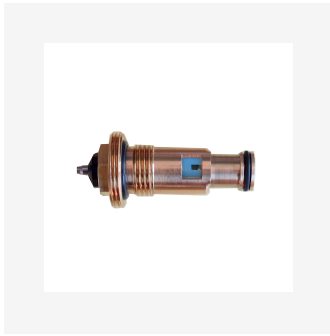
Insert thermostatique Oventrop