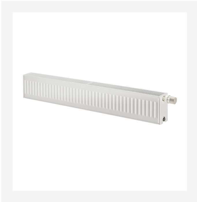
ProductImage - Panel radiator Plint, 200 mm.