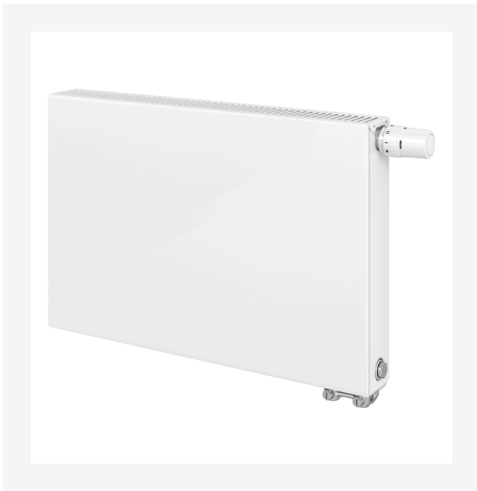
ProductImage - Vonoplan