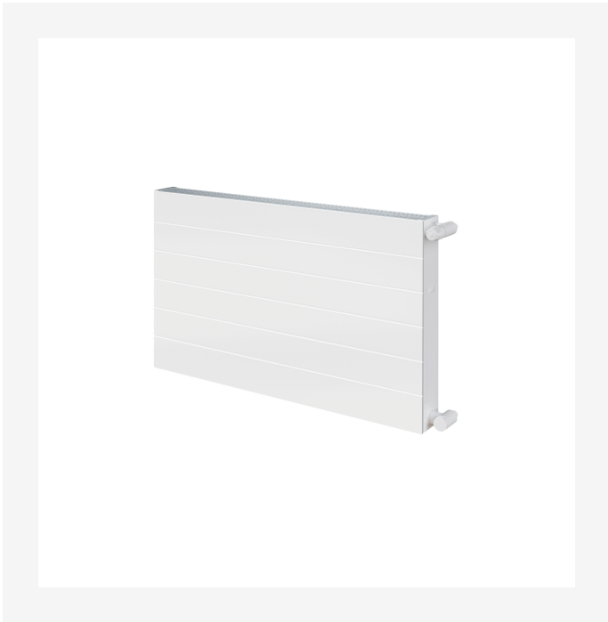
ProductImage - Radson-Compact-Ramo-NG-2000x2000