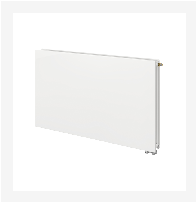
ProductImage - Vonoplan Hygiene