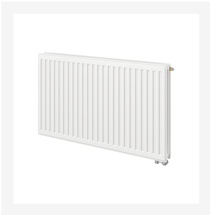
ProductImage - Vonova Hygiene Ventil