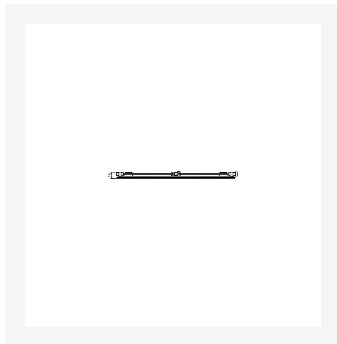
DimensionalDrawing - T6 3010 Plan Tertiaire, type10, Top view