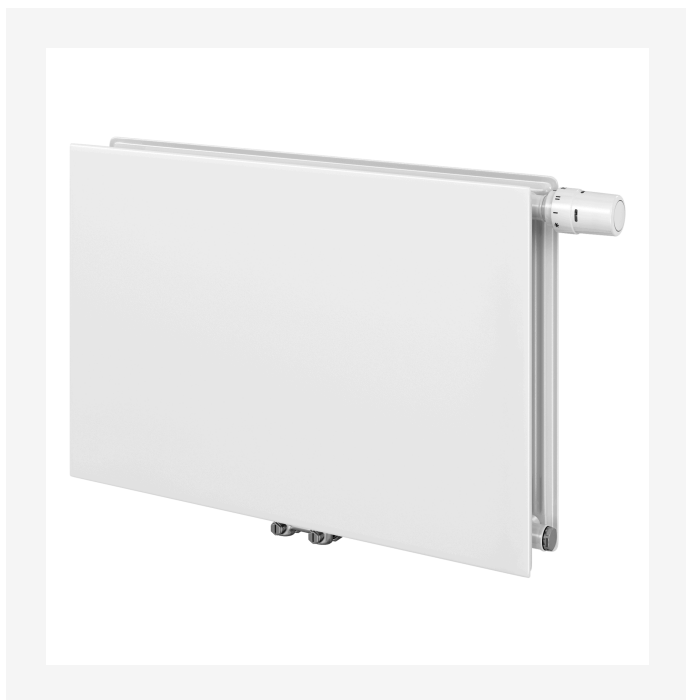
ProductImage - T6 3010 Plan Tertiaire