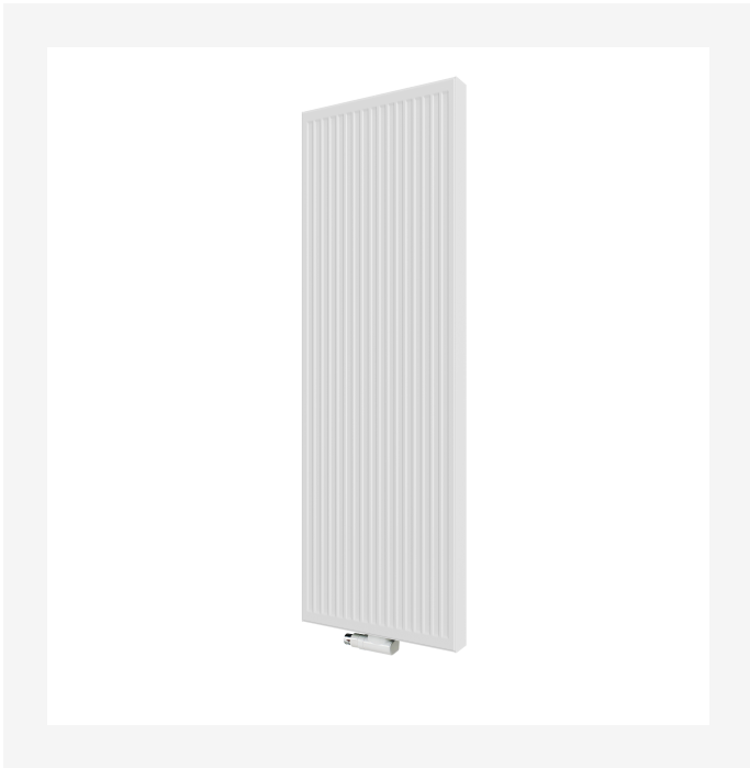
ProductImage - New_Vertical-MAIN picture