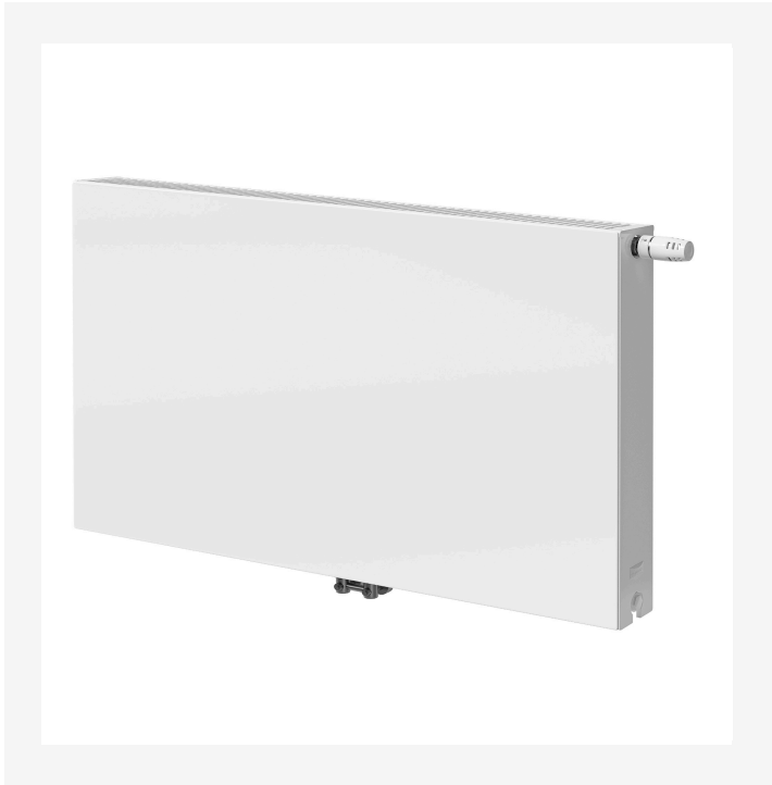
Imaginea produsului (HR) - P-Flex-Plan-2000x2000px