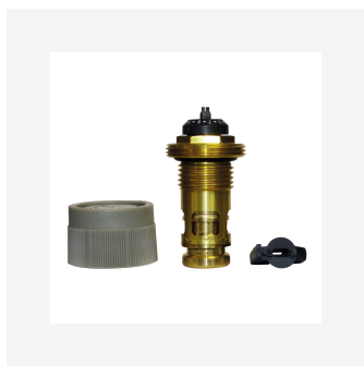
Dynamisk ventilinnsats PRQ