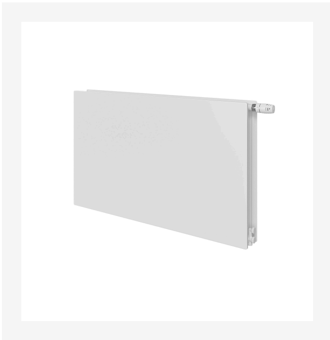
ProductImage - thermopanel_V4_hygiene_plan_type_20_studio