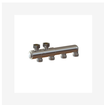
Quattro Fordeler CC40 med avstengning