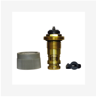
Dynamisk ventilinnsats PRQ