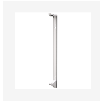
Veggekonsoll Thermopanel hygien