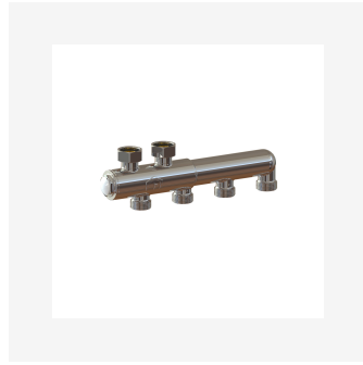
Quattro Fordeler CC40 med avstengning