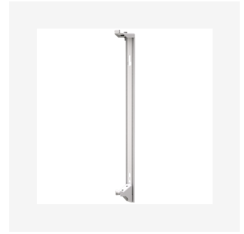
Veggekonsoll Thermopanel hygien