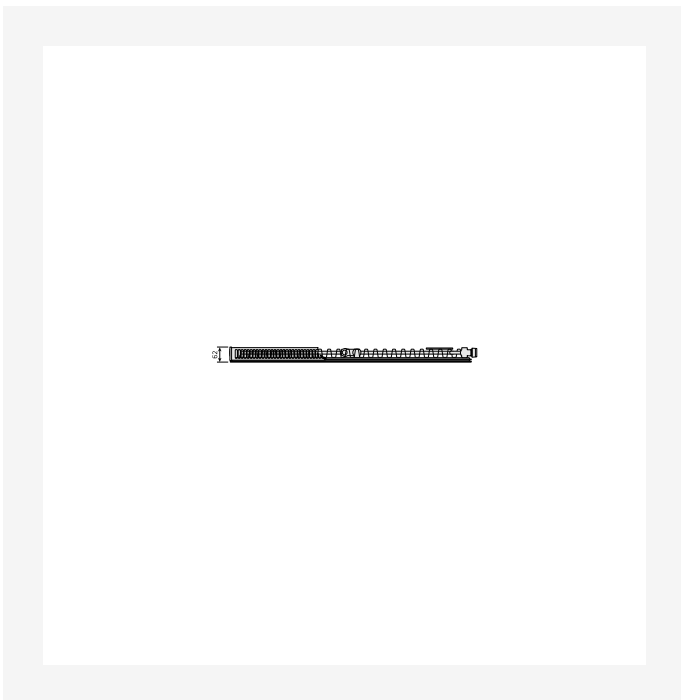
DimensionalDrawing - Plan Ramo Flex topview, type 11