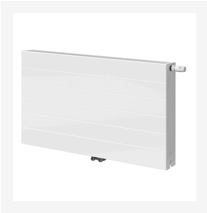
ProductImage - P-Flex-Ramo-2000x2000px