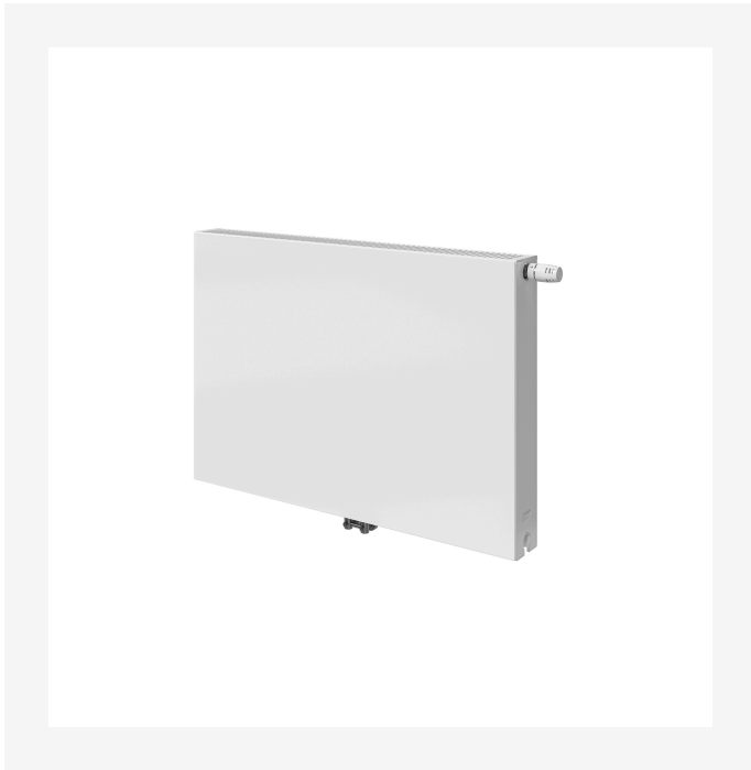
ProductImage - Integra-Parada-Flex-8c-2000x2000.png