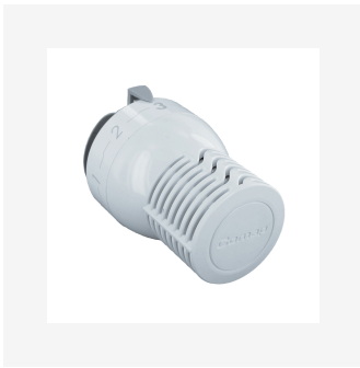
Tête Thermostatique Sensity M30