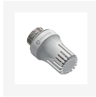
Tête thermostatique TRVFIN3