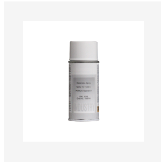
Aérosol peinture réparation