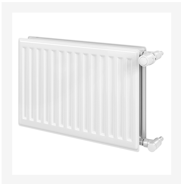
ProductImage - Reggane 3010 Standard