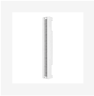
Grille supérieure Vonova