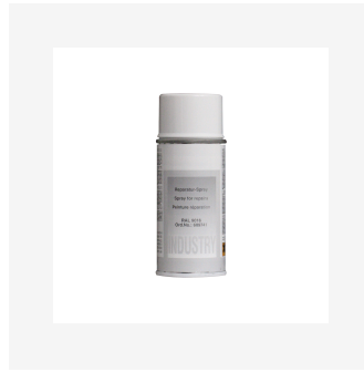
Aérosol peinture réparation