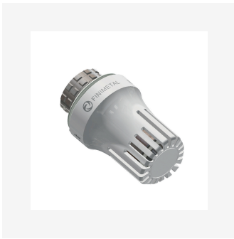
Tête thermostatique TRVFIN3