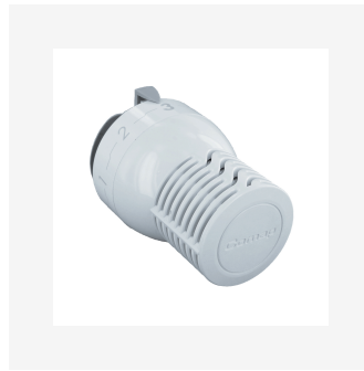
Tête Thermostatique Sensity M30